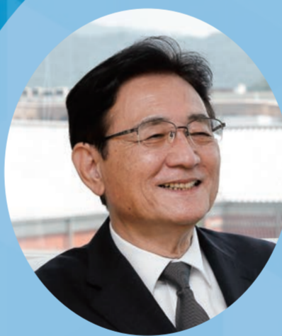
湊 長博 京都大学 総長

1951年、富山県生まれ。医学博士。専門は免疫学。1975年京都大学医学部卒業後、京都大学研修医、米国アルバート・アインシュタイン医科大学研究員、自治医科大学助教授などを経て、1992年に京都大学医学部教授に就任。2010年京都大学大学院医学研究科長・医学部長、2014年京都大学理事・副学長、2017年10月よりプロボストを務めた後、2020年10月より第27代京都大学総長に就任。免疫細胞生物学の多彩な基礎研究を展開、2018年ノーベル生理学・医学賞受賞者 本庶佑教授の共同研究者として新しいがん免疫療法の開発に貢献。最近は免疫老化研究にも新局面を開いている。